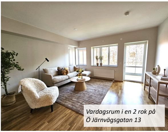
Vardagsrum i en 2 rok på Ö Järnvägsgatan 13