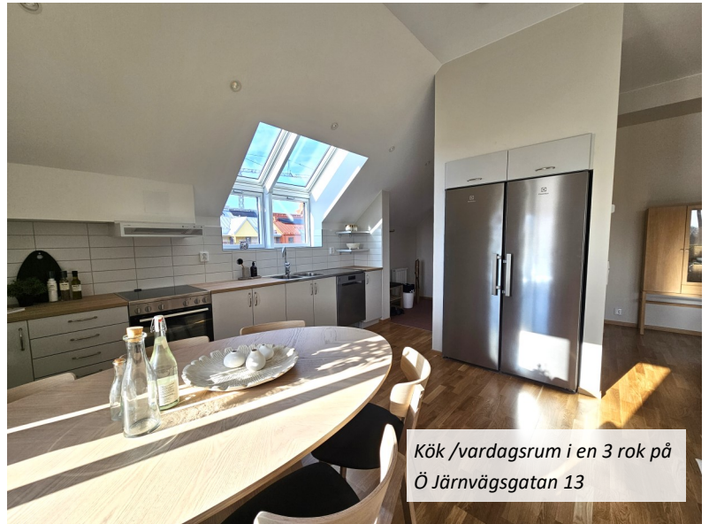
Kök /vardagsrum i en 3 rok på Ö Järnvägsgatan 13